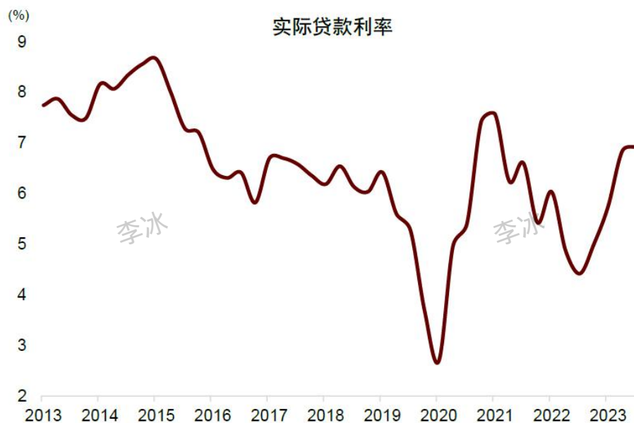
图表 4: 银行成本率有下行空间