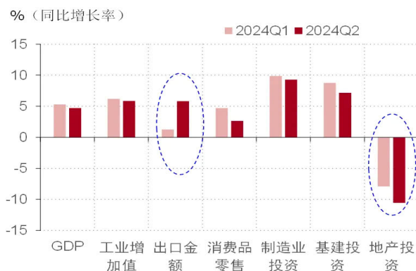
图表 2. 2024 年上半年，我国经济“外暖内冷”，出口是亮点，地产投资是主要压力所在

冷”。一方面，我国出口表现不错，带动相关行业（尤其是高技术制造业）景气处于高位。另一方面，国内地产行业的风险仍然没有得到有效遏制，地产投资增长在今年 2 季度进一步下滑。受地产行业的拖累，国内投资相关行业表现不佳。而在收入增长预期弱化的背景下，国内消费也显出疲态（见图表 2）。