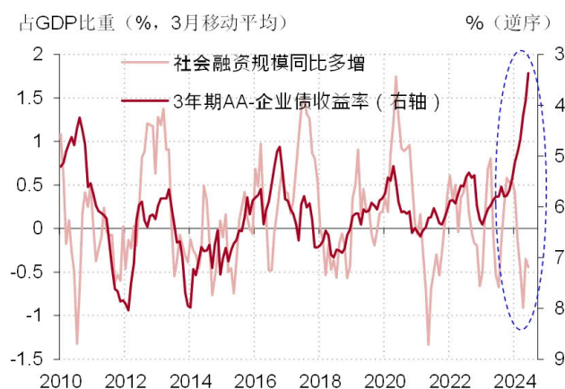
图表 4. 我国实体经济融资的利率敏感性已经显著降低，社会融资规模与利率的走势明显背离

货币宽松可以降低金融体系中的资金成本。正常情况下，面对更低的资金成本，实体经济主体的借款意愿会相应上升。但如果实体经济中的各主体对未来缺乏稳定预期（不管是收入预期，财富预期，还是投资回报的预期），则资金成本的下降也难以带动经济主体的借款意愿和支出意愿（见图表 4）。