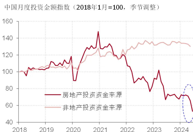
图表 3. 房地产投资资金来源规模在 2024 年 6 月再度明显走低

从 2024 年 6 月的数据来看，地产的下行风险有加大的迹象。过去几年，趋势性走低的房地产投资资金来源体现了地产行业的压力。房地产投资资金来源指标涵盖了房地产企业从定金及预付款、开发贷、按揭贷款、自筹等各个渠道获取的资金总量。该指标的下行，意味着房地产企业资金链紧绷，自然会让地产投资跟随走低。房地产投资资金来源规模在低位稳定了接近一年之后，在今年 6 月再度明显走低。从最新的数据来看，正在推进的“保交楼”、“项目白名单”、限购放松等地产救助政策的效果并不明显，地产的下行压力并未得到控制（见图表 3）。