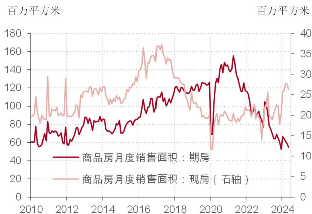
图表 6. 2021 年以来，商品房期房销售面积下降超过一半，商品房现房销售面积反而上升

是因为收入预期或是人口老龄化而下降，应该看到的是商品房期房和现房销售面积同时下降才对。从商品房期房和现房销售的反差走势来看，对期房“烂尾”的忧虑，及其反映对房地产企业信用风险的担忧，是抑制地产整体销售，阻碍地产市场正常循环的主要原因（见图表 6）。