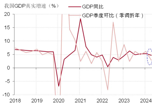
图表 1. 2024 年 2 季度，我国 GDP 环比增速明显走低

2024 年 2 季度，我国经济增长放缓，今年全年达成 5% 增长目标的难度上升。2 季度，我国 GDP 同比增长 4.7%，增速比 1 季度放缓 0.6 个百分点，低于之前市场预期。根据统计局的估算，2 季度季节调整之后的 GDP 季环比增速（折年率）更是明显下滑到了 2.8%，已比全年增长目标低了不少。如果经济增长的环比势头不能在今年下半年显著改善，今年实现增长目标的难度会比较大（见图表 1）。