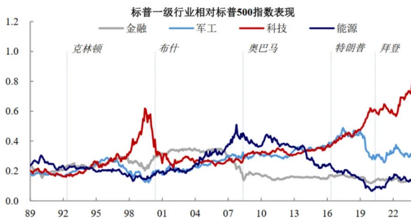
图表1：冷战后历任总统任期内部分美股行业的相对表现

美国大选是2024年市场关注的焦点之一。一方面，选举过程中的各类不确定性，比如近期特朗普遭枪击以及拜登宣布退选等事件，都可能会对金融市场产生短期冲击。另一方面，下一任总统竞选承诺和执政纲领，将会对经济、贸易、监管等诸多领域产生深远影响，从而对市场走势造成持续性的改变。在本文中，笔者将回顾冷战结束后五位总统的政策取向，并结合当时经济情况来观察美股的结构性变化，为投资者提供一个参考的视角。