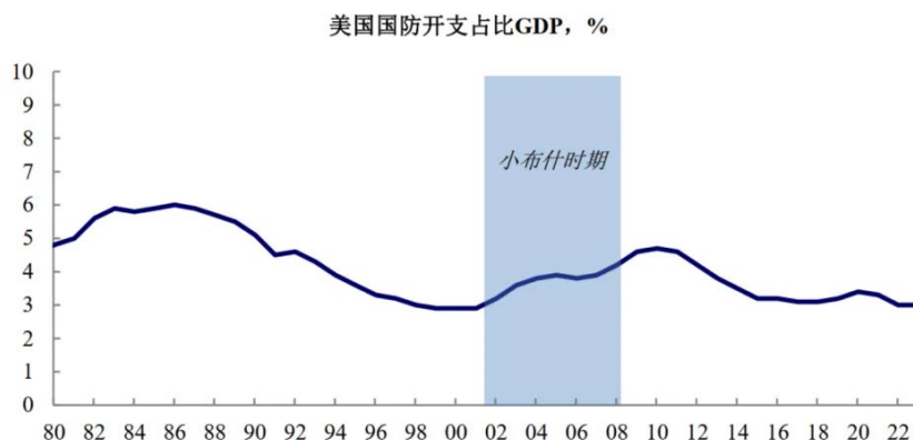
图表 4：小布什对外两次战争推升美国国防开支

4623 亿美元，且占 GDP 的比重从 2000 财年的 2.9% 上升至 2008 财年的 4.2%。在增加财政支出的同时，小布什在 2001 年和 2003 年两次推出大规模减税政策，使得联邦财政在维持了四年盈余之后，自 2002 财年起转为赤字并快速上升，2003、2004 年联邦赤字率均达 3% 以上，联邦政务债务也从 2001 年的 54.8% 升至 2008 年的 67.5%。