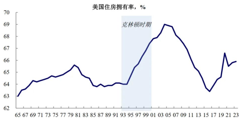
图表 3: 克林顿政府推出国家住房所有权战略, 致力于提高住房拥有率

首先, 苏联解体带来了“和平红利”。苏联解体以及冷战结束, 美国成为全球唯一的超级大国, 美国的实力在克林顿总统阶段进入巅峰。其次, 全球经济贸易一体化进一步深化, 世界贸易组织(WTO)在1995年成立, 取代了关税及贸易总协定(GATT); 北美自由贸易协定(NAFTA)在1994年生效。再次, 美国经济强劲增长。这一阶段美国经济平均增速高于全球, 1993-2000年美国GDP增速平均3.9%, 而全球是3.3%; 同时, 美国GDP占全球比例明显上升, 从1992年的25.6%上升至2000年的30.3%。该阶段是美国经济的繁荣时期, 表现为高增长、低通胀、低赤字、低失业率。偏强的经济基本面以及美国在全球的霸主地位, 给股市带来更多的支撑和信心。尽管美股在1997年亚洲金融危机以及1998年俄罗斯债务危机时期遭遇调整, 但整体上并未改变持续上涨的趋势。