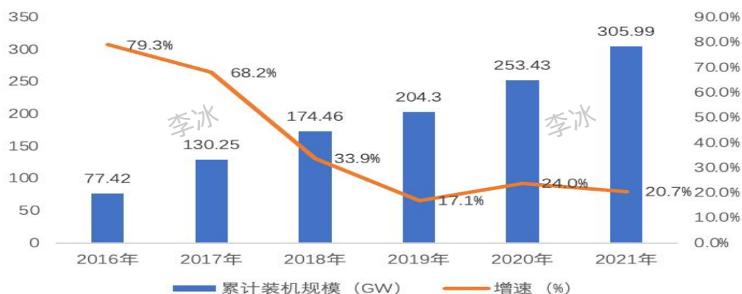
图 3 2016-2021 年中国光伏累计装机规模及增速

从装机规模增速上看，受分布式光伏发电装机容量发展提速影响，2016 年我国光伏累计装机容量增速创历史最高。受国家补贴政策影响，2018 年、2019 年新增装机容量大幅下降，导致累计装机同比增速下滑严重，2020 年后受国家光伏行业补贴、金融扶持等政策影响，光伏装机量增速有所回升。