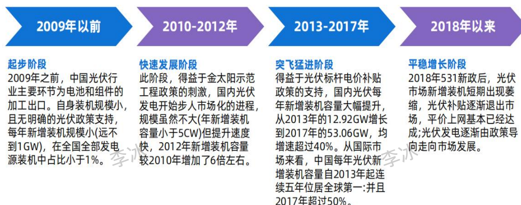
图 2 中国光伏产业发展历程

步参与国际竞争并达到国际领先水平的战略性新兴产业，我国光伏产业新增装机量连续 9 年位居全球首位、累计装机量连续 7 年位居全球首位。